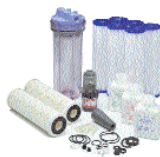
Kit préfiltre & entretien