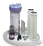
Silt Reduction Kit

Za vode z visoko vsebnostjo tujkov (npr. sidrišča z nizko globino, ipd.), priporočamo montažo dodatnega »PREFILTRA«. Ta dodaten filter ima zelo še bolj fino membrano (5 mikronov – 1 mikron = 0,001 mm), v primerjavi z standardnim filtrom (30 mikronov), ter je montiran za glavnim filtrom. Visoko zmogljiva vodna črpalka (12V/0,8 A/h) je vključena v paket. Ta črpalka kompenzira izgubo dodatnega (drugega) vodnega filtra ter poveča produkcijo sladke vode. Montažo dodatnega predfiltra priporočamo tudi v primerih, ko Razsoljevalec ni montiran pod vodno linijo, ter kadar ni v konstantni uporabi, z namenom povečanja servisnih intervalov.