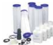
Extended Cruise Kit