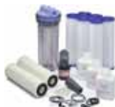
Preventative Maintenance Kit